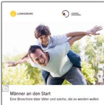
Die Broschüre ist kostenlos erhältlich

„Männer an den Start – eine Broschüre für Väter und solche, die es werden wollen“ entstand auf Initiative der Gleichstellungsbeauftragten der Stadt Ludwigsburg in Zusammenarbeit mit der Gleichstellungsbeauftragten des Landratsamtes Ludwigsburg und der Ludwigsburger Kreiszeitung.