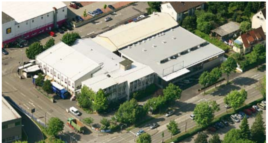
Ein Blick von oben: Das Druckhaus Götz in der Schwieberdinger Straße