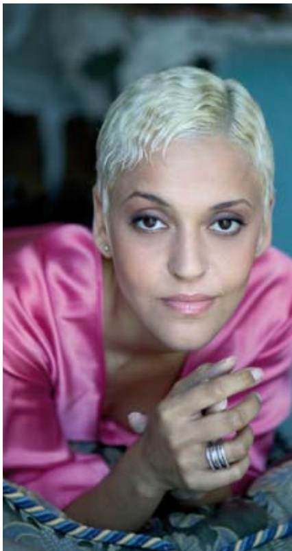
Die Königin des Fados: Mariza

Mit seinem erfolgreichen künstlerischen Konzept, der Verpflichtung von Ensembles und Interpreten von Weltruf, strahlt das städtische Kulturprogramm im Forum am Schlosspark besonders hell in der Ludwigsburger und Baden-Württemberger Kulturlandschaft.