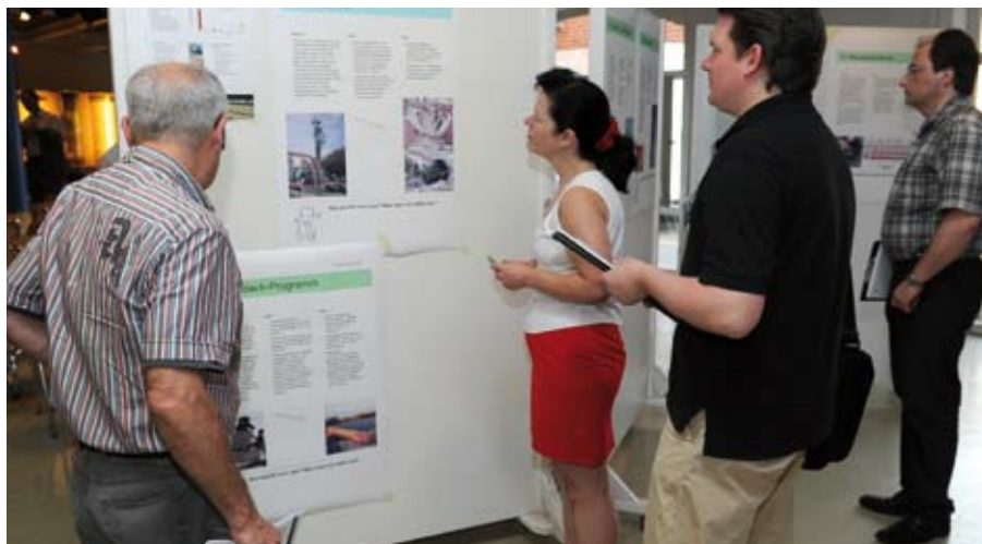
Eine Vielzahl von Ideen und Vorschlägen konnte am Schluss der Konferenz präsentiert werden

„Die Zukunftskonferenz hat sehr beachtliche Ergebnisse gebracht“, sagte der Ludwigsburger Oberbürgermeister am Ende der zwei Tage und äußerte die Hoffnung, dass kein Strohfeuer entzündet wurde. „Allein auf die politischen Gremien zu vertrauen, bringt uns nicht weiter. Wir brauchen eine tausendfache Änderung des Verhaltens in unserer Ge-