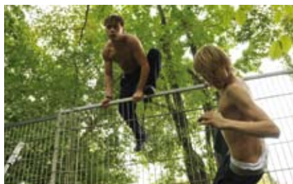
Eine Action-Szene aus dem Film „Parkour“

Medienlandschaft ist es natürlich eine ungemene Herausforderung mit all den Firmen in den Medienstandorten Berlin, Köln und München hier aus Ludwigsburg heraus zu konkurrieren. Aber wir wollen nichts lieber als mit unseren Produktionen auf Baden-Württemberg und die guten