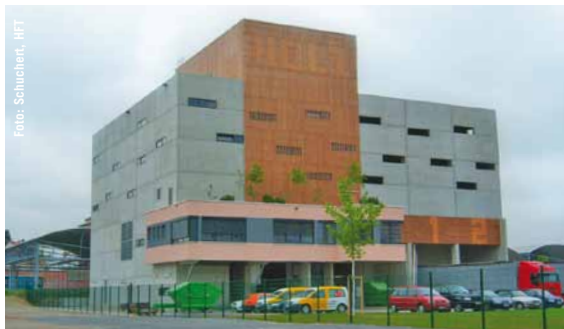
Holzheizkraftwerk in Ludwigsburg.

Ludwigsburg kann durch den Bau des neuen Holzheizkraftwerkes neben einer Reduktion der CO 2 -Emissionen auch rund