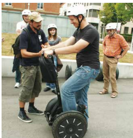
Segway-Fahren: Ein großes Vergnügen.

Seit April dieses Jahres kann man Ludwigsburg per Segway er“fahren“. Zusammen mit dem Veranstalter Adventours bietet die Stadt-