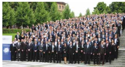
MHP Mitarbeiter beim Strategie-Meeting.

Wenn die Berater von Mieschke Hofmann und Partner (MHP) ein Projekt abschließen, hat sich in der Regel bei dem betreuten Unternehmen einiges verändert. Dann hat zum Beispiel der Automobilhersteller seine Lieferkette neu organisiert – er beschleunigt so die Abläufe und senkt die Kosten. Der Prozesslieferant MHP erreicht solche Erfolge für die Kunden mit seinem ganzheitlichen Beratungsansatz – der Symbiose aus Prozess- und IT-Beratung. MHP liefert den Kunden auf diese Weise perfekt laufende Prozesse entlang der gesamten