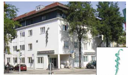
Die NC Klinik am Forum.

Das sogenannte Standardpaket gibt es deshalb auch nicht. Jedes Unternehmen hat andere spezifische Anforderungen und verfolgt andere Ziele mit dem Thema Ge-