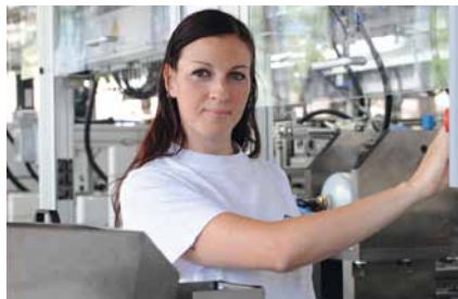
Ludwigsburger Schülerinnen und Schüler erhalten Einblicke in 24 Unternehmen.

Die Schülerinnen und Schüler haben in den Sommerferien die Gelegenheit, ein oder