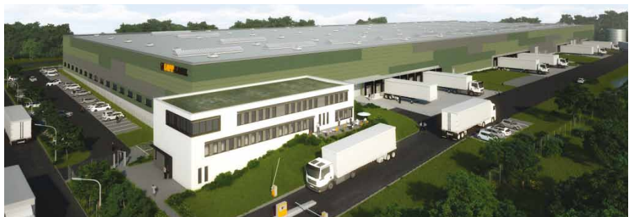
Der riesige Neubau entsteht auf den Hinteren Halden in Ludwigsburg.

Das Bauprojekt stellt eine Investition von rund 26 Millionen Euro dar und wurde von der Lapp Gruppe gemeinsam mit dem Düsseldorfer Projektentwickler greenfield development GmbH