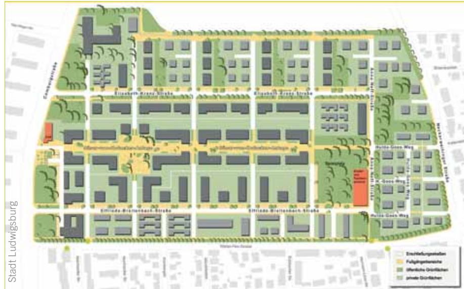
Plan des Wohngebiets Hartenecker Höhe

gemeinschaften. Darin haben sich Menschen zusammengefunden, die wie in Freiburg oder Tübingen gemeinsame Bauräume direkt mit ihren Architekten verwirklichen.