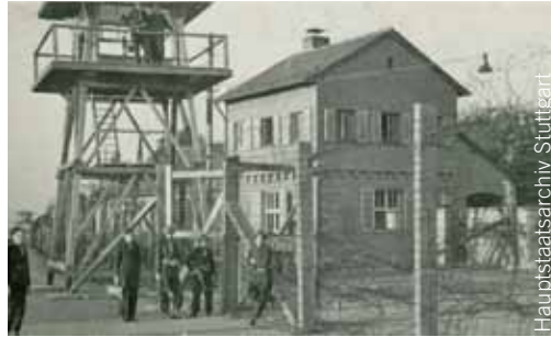
Internierungslager, um 1946