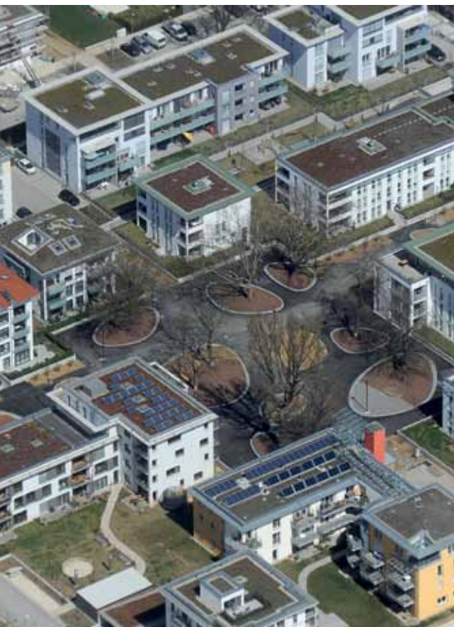
Die Cäsar-von-Hofacker-Anlage aus der Vogelperspektive