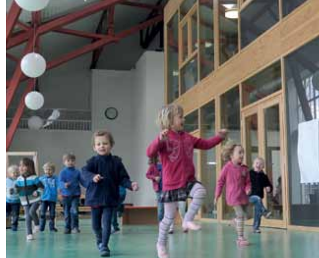
Malen, basteln, toben, springen (oder auch mal ausruhen): Kreativ und sportlich sind Kinder in und um das Kinder- und Familienzentrum unterwegs.