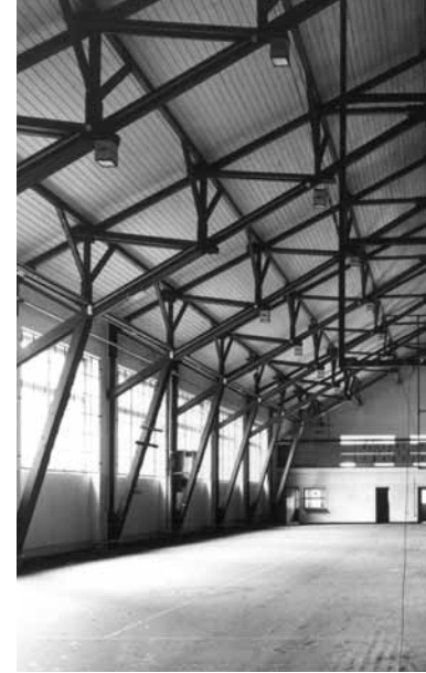
Sporthalle im Jahr 1999