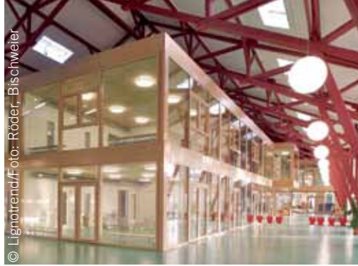
Bei mehr als 1000 Quadratmetern beheizter Nutzfläche wirkt das Haus-in-Haus-Konzept energiesparend.