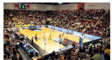
Die 2009 eröffnete MHPArena.