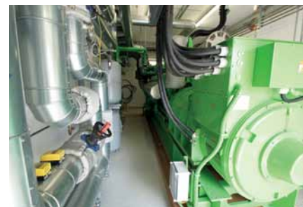
Neues Biomethan-Blockheizkraftwerk der Stadtwerke Ludwigsburg-Kornwestheim in Neckarweihingen.

Um überprüfen zu können, wie erfolgreich die Handlungsempfehlungen und