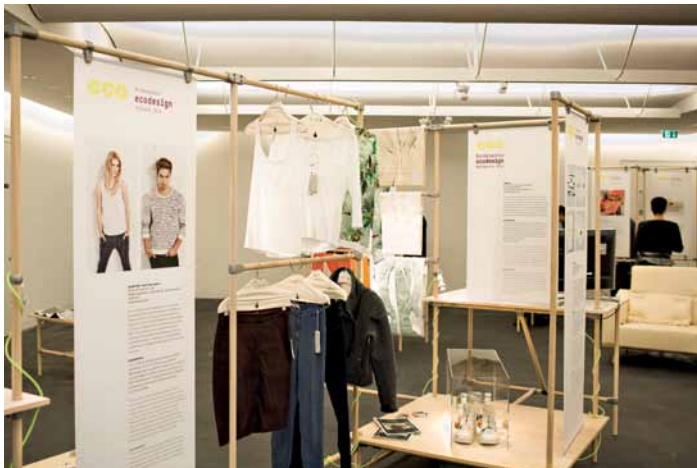
Gutes Design, das ökologischen und ökonomischen Anforderungen gerecht wird.

Unter dem Motto „Grüne Innovation kommt weiter“ haben das Bundesministerium für Umwelt, Naturschutz, Bau und Reaktorsicherheit (BMUB) und das Umweltbundesamt (UBA) 2014 bereits zum dritten Mal den Bundespreis Ecodesign vergeben.