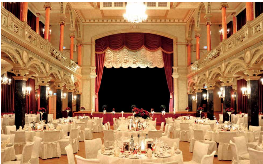
Die Musikhalle besticht mit ihrer reichen Ausstattung an Holz- und Stuckarbeiten.