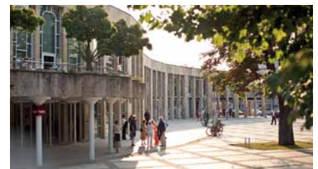
Das Forum am Schlosspark genießt einen hervorragenden Ruf.