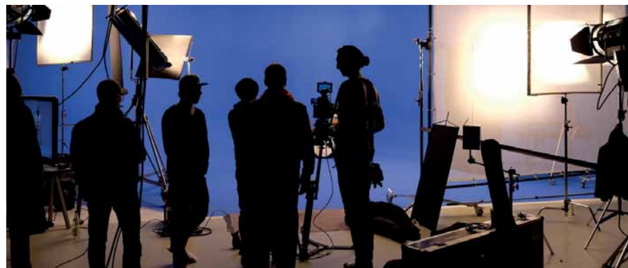
Studio 13 bietet modernste Technik und ein angenehmes Ambiente.