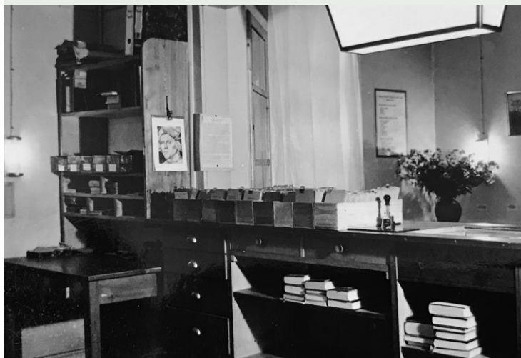
Theke der Stadtbibliothek Ludwigsburg, 1946

>> TAG > Donnerstag, 17.06. bis Sonntag, 04.07.2021