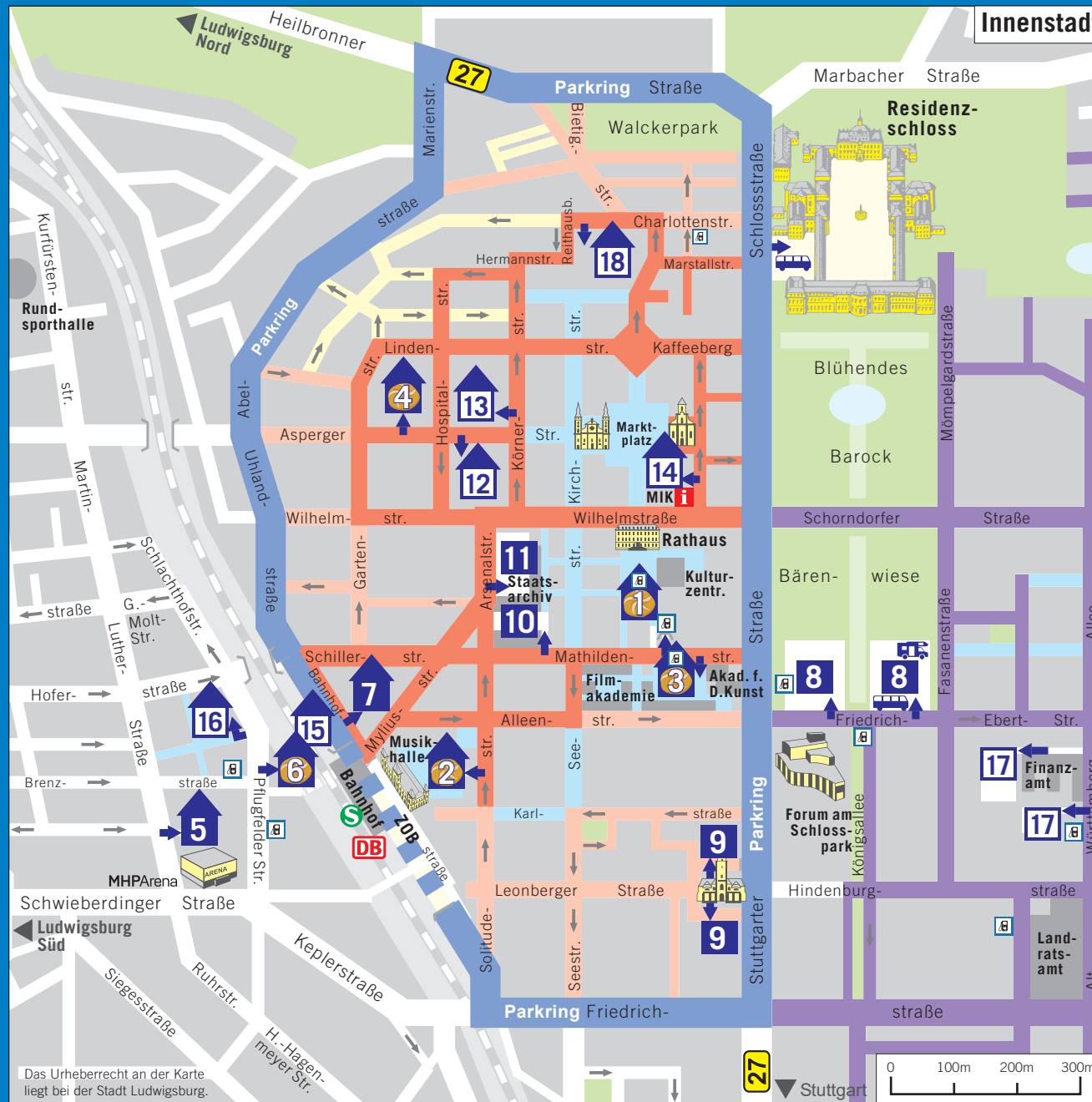
Das Urheberrecht an der Karte liegt bei der Stadt Ludwigsburg.