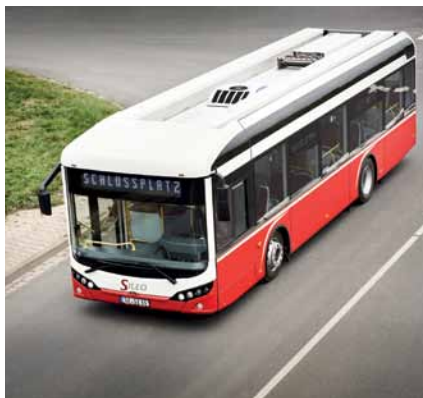
Ein Linienbus mit Batterie auf dem Dach.

Durch die deutlich geringere Lärmbelastung im Fahrbetrieb gegenüber konventionellen Bussen kann der Einsatz von Elektrobussen ein Aktivposten in einem Lärmschutzkonzept sein. Neben dem Flüstereffekt kann der Elektrobuss seine Umwelt- und Klimafreundlichkeit gegenüber konventionell