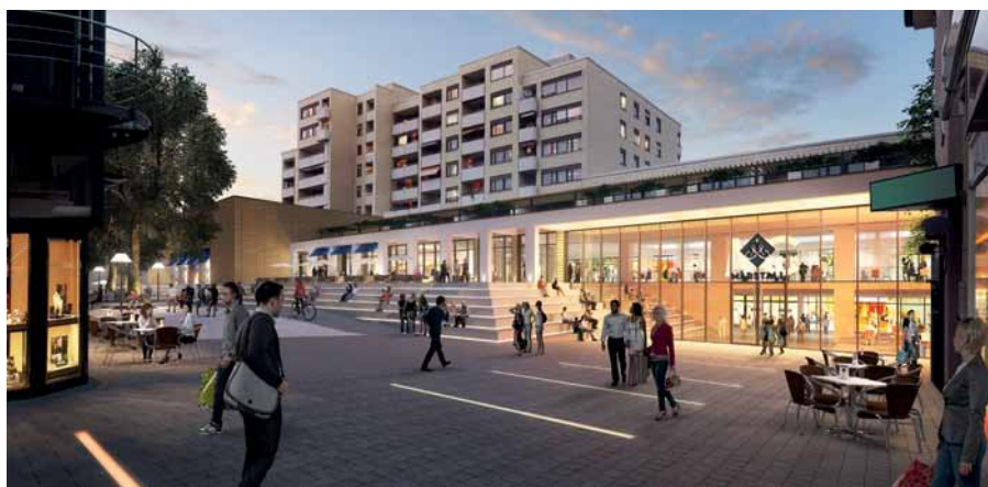
Komplettumbau für rund 100 Millionen Euro: Der neue Marstall.

Die Bauarbeiten im Innen- und Außenbereich schreiten mit großen Schritten voran und liegen voll im Plan, so dass der neue Marstall pünktlich am 30. September 2015 eröffnet wird.